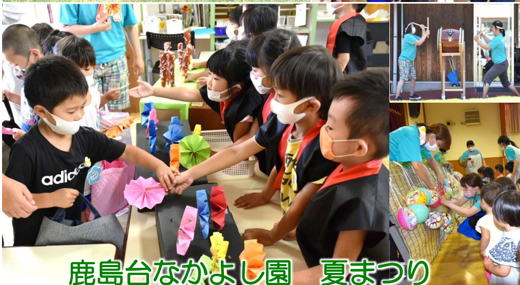
鹿島台なかよし園 夏まつり