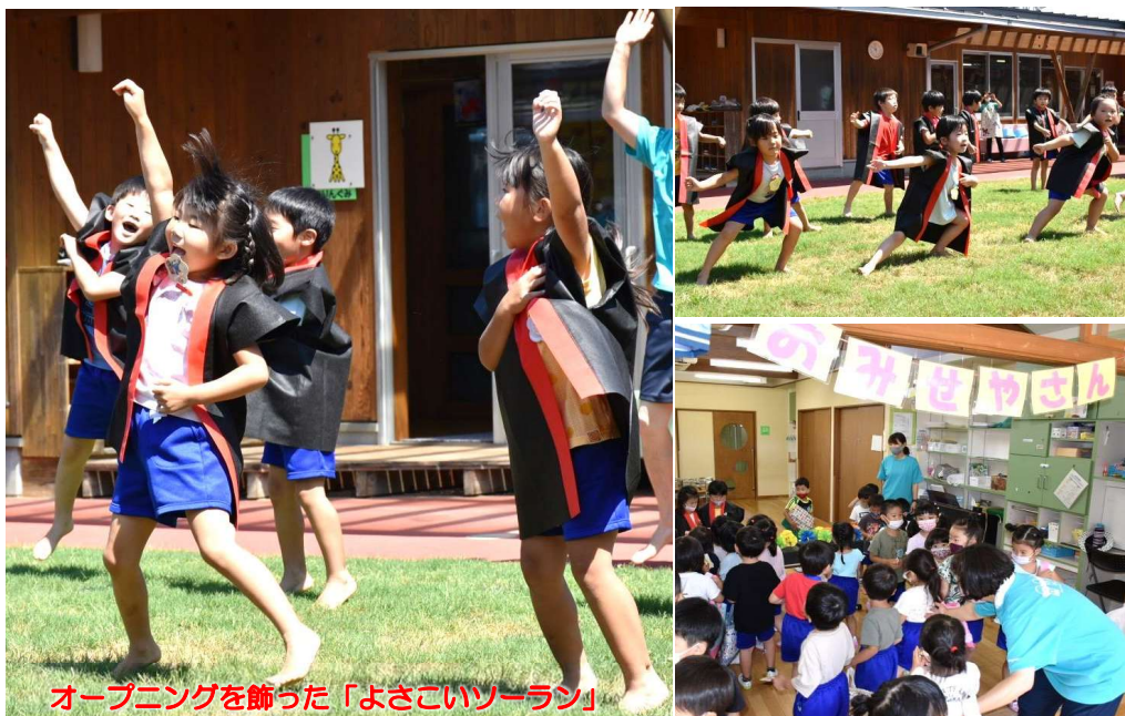
オープニングを飾った「よさこいソーラン」