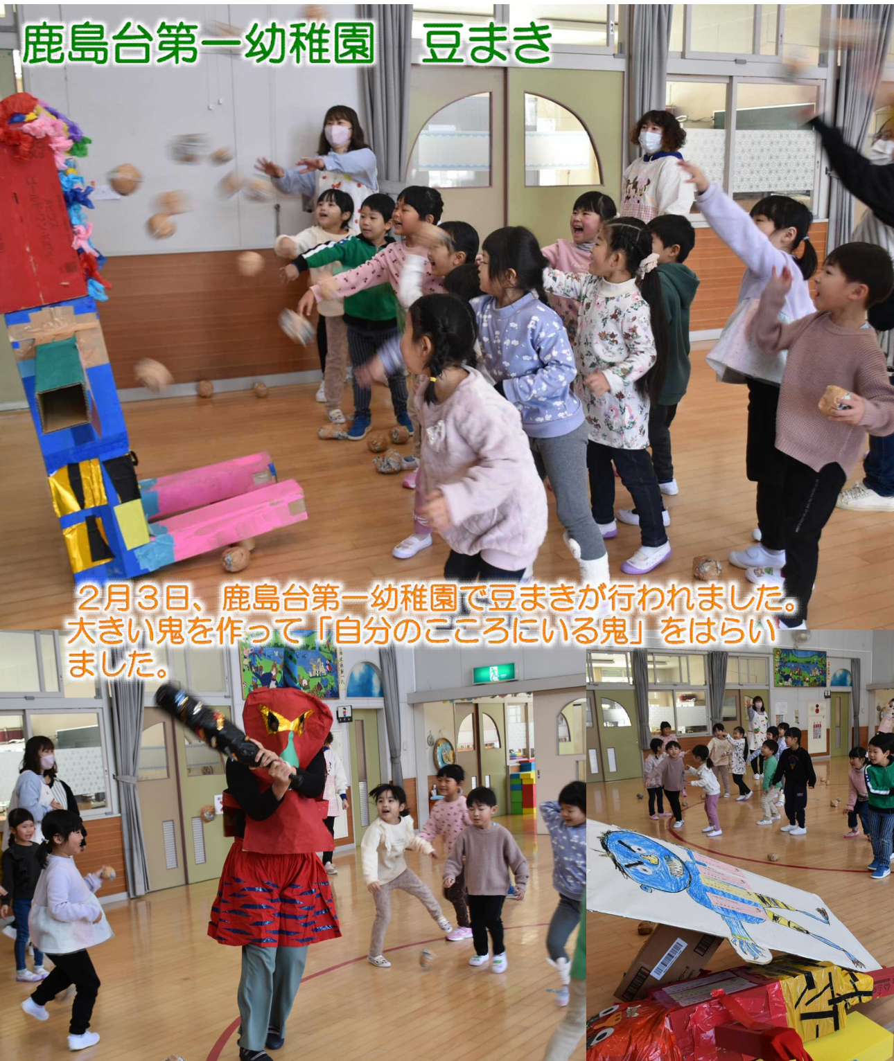
鹿島台第一幼稚園 豆まき