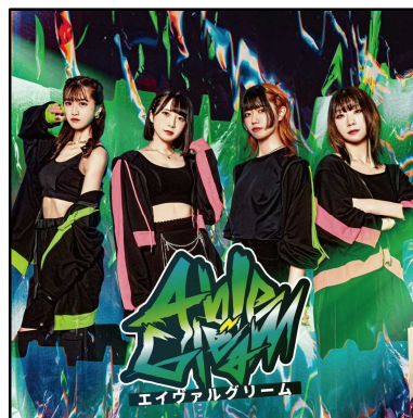
エイヴァルグリーム