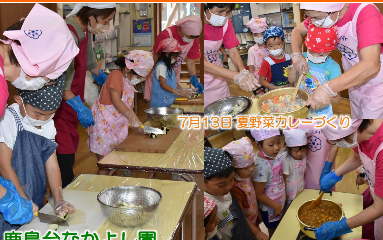
7月13日 夏野菜カレーづくり