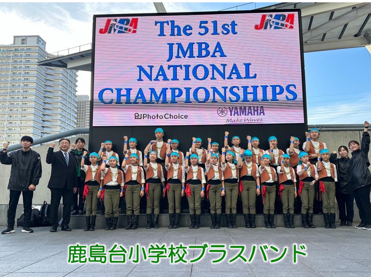
鹿島台小学校ブラスバンド

12月9日(土)にさいたまスーパーアリーナにおいて 開催された第51回マーチングバンド全国大会に出場し、 見事に銀賞を受賞しました!