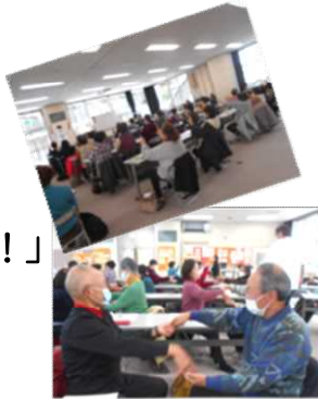
～昨年度の参加者の様子～

【申込み・お問合せ】社会福祉協議会鹿島台支所 ☎0229-56-9420 市民福祉課 ☎0229-56-7114