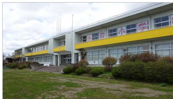
校舎等の外観写真