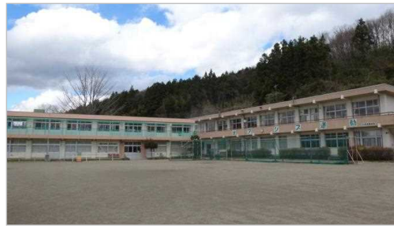
校舎等の外観写真