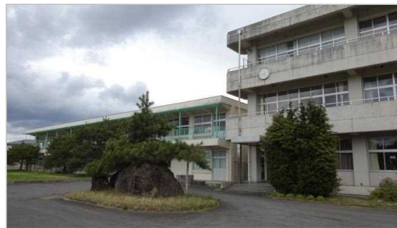
校舎等の外観写真