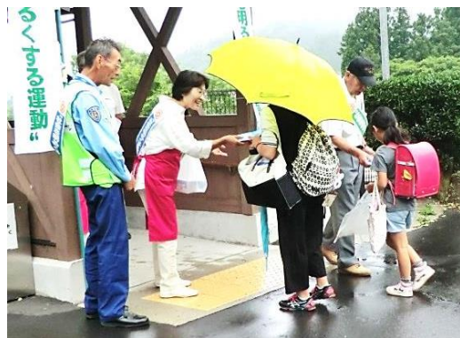
▲昨年の啓発活動の様子

社会を明るくする運動は、毎年7月を強調月間として、犯罪や非行の防止、罪を犯した人たちの更生について理解を深め、すべての国民がそれぞれの立場において力を合わせ、犯罪や非行のない明るい地域社会を築こうとする全国的な運動です。