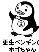
更生ペンギンの ホゴちゃん

運動期間中は、鳴子地域においても駅前や街頭での啓発活動、保護司などによる小中学校訪問を行い、より多くの皆さんに社会を明るくする運動への理解を深めていただく取り組みを推進します。