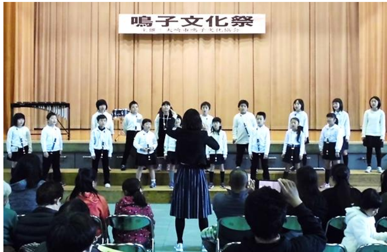
11月10日(土)11日(日)の両日「第51回鳴子文化祭・第11回鳴子温泉地域小中学校絵画展」が開催され、多くの入場者でにぎわいました。 (写真は鳴子小学校3・4年生の合唱)