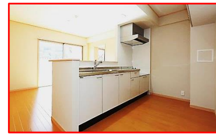
写真上：外観 写真下：室内(3DK)

冬の寒さの本格化を前に、末沢の旧鳴子中学校跡地に鳴子温泉住宅が完成し、12月10日に入居者へ鍵が引き渡されました。 鳴子温泉住宅は鉄筋コンクリート3階2棟からなり、付属棟を含めると建物延べ面積は6,518.33平方メートル。1DKから3DKまで合計66戸で、住民の交流の場となる集会所も整備されています。 老朽化した上鳴子住宅と鳴子坂ノ上住宅から併せて51世帯、その他12世帯が順次入居します。現在3戸の空きがあり、広報おおさき3月号に入居者募集のお知らせを掲載する予定です。