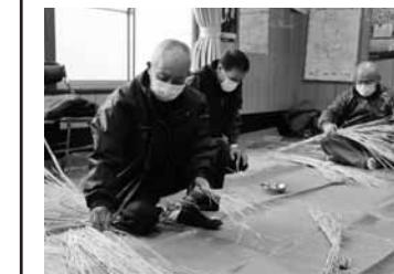
▲慣れた手つきで縄をなう総代の皆さん

皆さんは、どのような思いや願いを持って新年を迎えられたでしょうか。去る12月、古川地域にある古川神社では、神棚にまつる「お正月様(お札)」を地元の氏子へ頒布したり、破魔矢づくりなど新年を迎える準備が行われました。また、総代の皆さんが集まり、神社の大鳥居や本堂に飾るしめ縄づくりも行われました。お正月を迎えるにあたり、各地域や家庭では、それぞれの伝統や風習などにより準備されたことと思います。家の内外を掃除して、神棚にしめ縄をはったり、正月独特の飾りつけをすることなども宮城県伝統の一つです。本年が皆さんにとって、より良い年になることを願います。