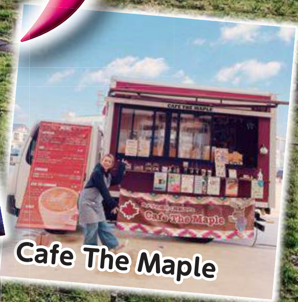
Cafe The Maple