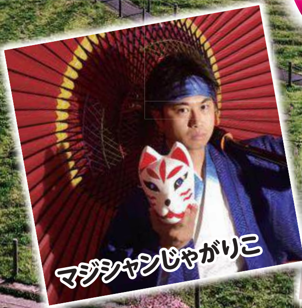
マジシャンじゃがりこ