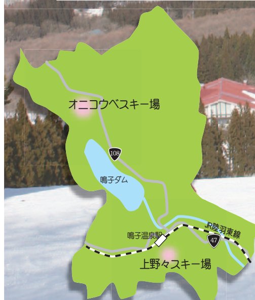
写真はオニコウベスキー場