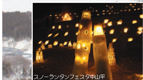
スノーランタンフェスタ中山平

本格的なスキーシーズンが到来しました。鳴子温泉地域は、言わずと知れたスキー王国。スキーヤーもスノーボーダーも、初級者も上級者も、子どもも大人も、思う存分楽しめる二つのスキー場があります。 その一つが上野々スキー場。県内で最も早い大正十二年に開設し、昭和三十年代にはナイター設備も設置された歴史あるスキー場です。全体的になだらかな斜面が多く、家族連れにぴったり。ゆったりのんびり滑りたい人は、上野々スキー場がお勧めです。最近では、スノーボーダーの利用も多くなりました。 もう一つは、全国有数のスキーリゾート、今シーズンで三十周年を迎えたオニコウベスキー場です。栗駒国定公園内に位置するカルデラ地形を生かしたスキー場で、雪質良好な十コースが設定されています。圧雪されたコース、自然の地形を生かしたコース、新雪が続くコース、こぶが続くモーグルコースなど、スキーヤーからスノーボーダーまで十人十色の楽しみ方ができる、バラエティゆたかなコースが、県内はもとより、県外の多くの人たちを引きつけています。 鳴子温泉のスキー場に、あなたのシユプー