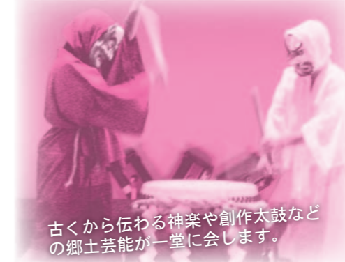
古くから伝わる神楽や創作太鼓などの郷土芸能が一堂に会します。

出演 古川みずも会(太鼓)、長岡太鼓の会(太鼓)、矢田田植踊り保存会(舞)、志田東部鼓友会(太鼓)、川熊神楽保存会(神楽)、保柳子神楽愛好会(神楽)、小原家太鼓(太鼓)、保柳神楽保存会(神楽)、宮袋併取舞保存会(舞)、高倉 葉 太鼓(太鼓)、高倉こども太鼓(太鼓)、南部流長瀬神楽保存会(神楽)、北町青和会(三本木地域)、田尻神楽クラブ(田尻地域)