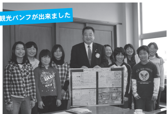
観光パンフが出来ました

中山小学校の5年生と6年生9人が、地域を訪れた人たちに中山平を存分に楽しんでもらうため「中山平パンフレット」を制作し、そのPRのために市役所を訪問しました。自分たちが住んでいる地域の文化や伝統、見どころを取材し、みんなで力を合わせて作りました。出来上がったパンフレットは、地元の人しか知らない情報も掲載されていて、見る人の心を躍らせる内容となっています。中山平観光協会では観光PRに活用していく予定です。