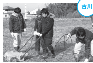
律令支配の北限か!? 本格的寺院の可能性も

3月3日から3日間、東大地区の伏見廃寺跡で市と東北学院大学大学院が共同で物理探査調査を行いました。過去の調査で白鳳時代の北限の寺院だったことが知られていました。今、今更には弘明以外に塔や講堂などの建物が存在するのを探るため、レーダーや電気磁気を使い調査を実施。今回の調査に基づき研究を進め、寺院の解明を目指します。