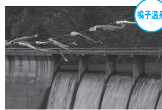
たくさんの鯉のぼりを泳がせたいですね

市では毎年、ゴールデンウィークに鳴子ダム管理所の協力で、鳴子ダムで「鯉の滝のぼり」を実施し、春の風物詩として皆さんに楽しんでいただいています。ご家庭で不要になった大きい鯉のぼりがありましたら、無償でお譲りいただけませんか。ご協力をお願いします。鳴子総合支所観光農政課 ☎202026