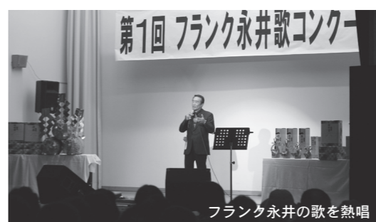
フランク永井の歌を熱唱