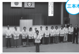
三本木まちづくり協議会の1年間の活動報告です

3月16日、「明日に向かって三本木フェスティバル」が三本木総合支所ふれあいホールで開催され、チャレンジ事業「三本木地域の伝説と物語 伝承事業」の発表、講演が行われました。「これからの三本木の地域づくりについて」と題した話し合いも行われ、参加した皆さんから地域を思うたぐさんの貴重な意見や提言が出されました。