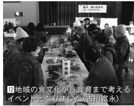
12 地域の食文化から食育まで考えるイベントとなりました(古川富永)