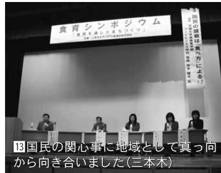
13 国民の関心事に地域として真っ向から向き合いました(三本木)