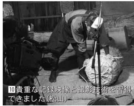
10 貴重な記録映像と撮影技術を習得できました(松山)