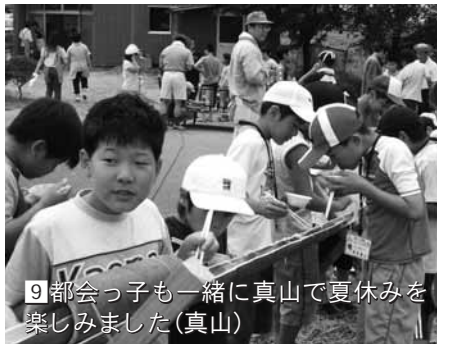
9 都会っ子も一緒に真山で夏休みを楽しみました(真山)