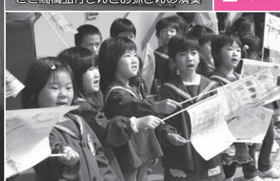
子どもたちも盛大にお客さまをお出迎え・お見送り