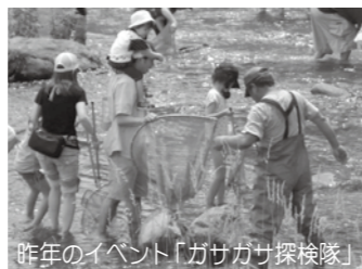
昨年のイベント「カサガサ探検隊」

日時 7月25日(土) 9時30分～ 場所 荒雄湖畔公園 定員 200人(先着順) ※申し込みなどの詳細については、7月上旬に決定しますので、鳴子ダムウェブサイトをご覧ください。 URL http://www.thr.mlit.go.jp/naruko/