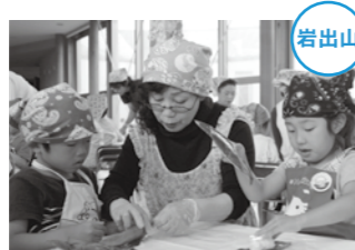
世代を越えて、地域の風習を伝えていきます。

6月5日、岩出山保育所の子どもたち59人が「笹まき作り」に挑戦しました。この行事は、岩出山地域に昔からある風習を子どもたちに伝えるべく、毎年行われているものです。保育所の近くの人や、園児のおおあちゃんなどにボランティアで作業を手伝ってもらい、子どもたちは夢中になって笹まきを作りました。