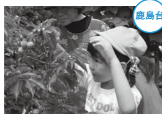
大きい梅を探しながら、次々に収穫していきました。

6月12日、鹿島台幼稚園の園児14人が、鹿島台学童農園近くの農家で「梅の収穫」を行いました。園児たちは、たくさん実った梅を友達と競い合うように取り、袋いっぱい詰めて帰りました。この日収穫した梅は、地域の人たちに手伝ってもらい、子どもたちが梅干しに加工します。