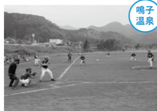
各チーム優勝を目指して白熱した試合を繰り広げました。

5月27・28日の両日、鳴子江合川河川公園グラウンドで、「第5回北日本古希ソフトボール親善交流宮城鳴子大会」が開催され、東北各県が集まった14チームが熱戦を繰り広げました。打撃、走塁、守備、軽快な動きを見せる選手たちの姿は若々しく、年齢を感じさせない好プレーを見せてくれました。