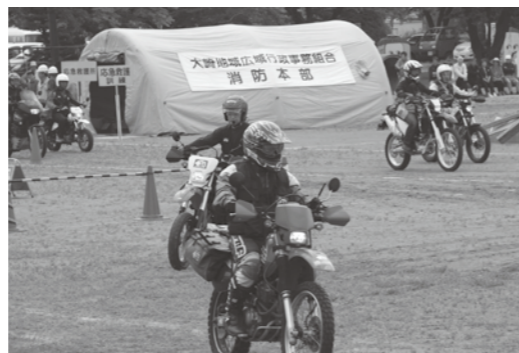
▲「道路に陥没箇所あり」。ボランティアバイク隊が市内の被害状況を調査してきました。

6月14日、敷玉小学校を会場に、大地震を想定した総合防災訓練が行われました。昨年と同じ日に「岩手・宮城内陸地震」が発生し、地震の怖さを思い知らされたばかり。参加した人たちは、救出訓練や応急手当、初期消火やライフラインの復旧、炊き出しや給水などの各訓練に、本番さながらのきびきびした動作で取り組んでいました。