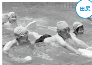
1年ぶりのプールにみんな大はしゃぎでした。

6月、市内の各小学校でプール開きが行われました。6月9日には、田尻地域の沿部小学校でプール開きが行われた後、三年生のみならず、今年初めてのプールにみんな大興奮！「つめたいけど気持ちいい」「楽しい」などと声を出し、夏の日差しの下で元氣いっぱい水しぶきを上げていました。