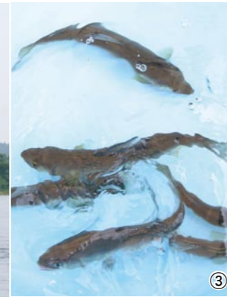
①解禁日はあいにくの天気でしたが、ご覧のにぎわい②おとり鮎の状態を時々チェックして、疲れさせないようにしながらポイントを攻略③元気のいいおとり鮎が釣果の分かれ目

大崎市内を流れる江合川は、長い釣りざおを使い「鮎の友釣り」を楽しむ人たちにぎわっています。