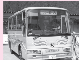
▲鳴子温泉地域市営バス