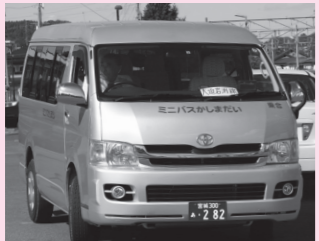
▲鹿島台地域ミニバス