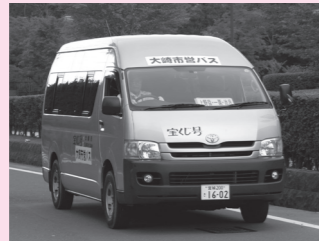
▲岩出山地域市営バス