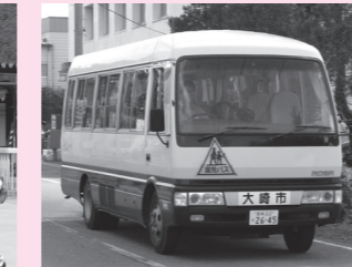
▲田尻地域思いやりバス