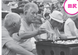
田尻自慢のお肉の味を堪能していました。

8月23日、加護坊山山頂東側キャンプ場を会場に、「おおさきジャンボ肉まつり in かごぼう」が開催されました。 家族連れや友人同士など、会場には約5,000人が訪れ、田尻産のおいしい牛肉や豚肉、新鮮な野菜を味わっていました。 ステージでは、田尻さくら高校ダンスサークルの踊りなどが披露されました。