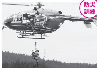
尊い命を救うため、隊員同士の連携も大切です。

8月28日、鳴子温泉地域の江合川河川敷公園一帯で、地上消防隊と防災航空隊がヘリコプターを使って合同訓練を行いました。 沢に滑落して遭難した人の救助を想定し、上空から隊員が降下して助ける本番さながらの訓練に、隊員の表情は真剣そのものでした。こうした日ごろの訓練が、災害時に役立ちます。