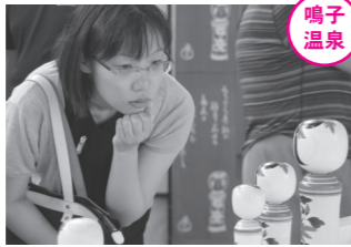
こけしを選定中。お気に入りの1本が見つかったでしょうか。

9月5日・6日の両日、鳴子小学校体育館や鳴子温泉街を会場に、「全国こけし祭り」と「鳴子漆器展」が開催されました。 今回は、青森県の津軽地方から人気のこけし工人が招待されたこともあり、例年以上の人出でにぎわいました。会場では、津軽の伝統芸能も披露され、一緒にこけしまつりを盛り上げました。