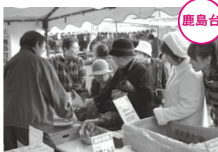
露店での会話も、互市の楽しみのひとつです。

鹿島台 開設100周年を迎え、今回で200回目となった鹿島台互市が、11月10日から12日まで開催されました。 期間中は雨の日もありましたが、約6万2000人もの人出でにぎわいました。 伝統の市に訪れた人たちは、200回を記念した各店舗のセールや、市内の物産を集めたコーナーなどを回り、思いおもいに楽しみました。