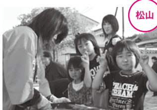
ジャンボのり巻きのおいしさに思わずにっこり！

松山 11月7日、松山酒ミュージアム前広場などを会場に、「まつやま邑まつり」が開催されました。 会場では、松山の伝統芸能「松山金津流獅子舞」や「次橋神楽」が披露されたほか、地酒の新酒試飲、仙台味噌使用の芋煮汁の試食、ジャンボのり巻き大会などが行われ、参加者は、文化の秋、食欲の秋を満喫していました。