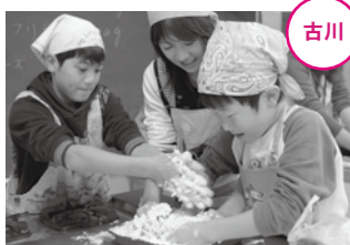
生地を作るときは、みんなで協力して行いました。

古川 11月11日、敷玉地区公民館で、「めっちゃうま！クッキング教室」が開催されました。 料理は、「ジャガだんご」。ゆでたジャガイモをかたくり粉を混ぜ生地を作り、チーズを入れて焼いたものです。 参加した敷玉小学校の三年生から六年生の児童19人は、慣れない手つきながらも、みんな力を合わせ楽しそうに料理していました。