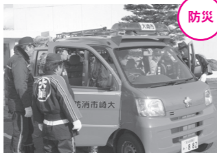
機能が満載の消防ポンプ付積載車で、地域を災害から守ります。

2月3日と25日に、消防ポンプ付積載車11台が、市から消防団に交付され、三本木、鹿島台、岩出山、鳴子の4支団に配属されました。 配属されたうち9台は、軽自動車ベースの積載車で、4人乗車可能で、サイレン、ランプと連動したオーディオが装備されていて広報活動にも威力を発揮するなど、機動力アップが期待されます。