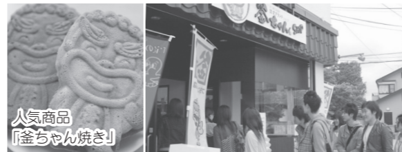
人気商品「釜ちゃん焼き」

日時 3月19日(金)・20日(土) 10時～16時 会場 釜ちゃんショップ、みちのく古川食の蔵・醸室 内容 1周年記念抽選会、NARUKO ジャパンブランド発表会・展示、大崎商工会ブランド商品発表会、釜ちゃん着ぐるみ写真撮影会など ※NARUKO ジャパンブランドは、3月17日(水)～23日(火)まで、みちのく古川食の蔵・醸室で展示