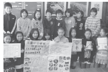
◀入賞した三本木小学校の子どもたち。防災マップを作るときに学んだことが、災害時に役立つことでしょう。