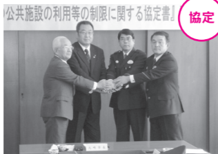
市民の皆さんが安心して暮らせるように、力を合わせます。

2月3日、市と古川警察署、鳴子警察署で、「暴力団の公共施設の利用等の制限に関する協定書」を締結しました。 この協定は、暴力団の資金源を獲得する機会を根絶することで、市民の安全を守るために結ばれたものです。 協定を結んだあとは、がちりちりと握手を交わし、街の安全のために全力を尽くすことを誓いました。