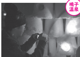
思わずカメラを向けてしまうほど、美しい雪のオブジェ。

2月6日、鳴子温泉地域中山平の「しんとろの湯」などを会場に、「2010スノーランタンフェスタ in 中山平」が開催されました。 参加者が思い思いに作った雪ろうそくや雪のオブジェに灯りがつくと、白銀の中に光が広がる幻想的な空間に包まれました。訪れた皆さんは、美しい光景に目を奪われていました。