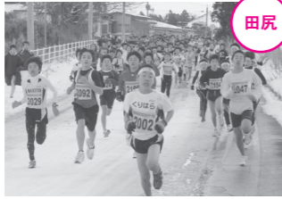
悪条件のなかでも、力強く駆け抜けました。

2月7日、田尻地域大賞地区のコースを走る「田尻クロスカントリー大会」が開催されました。 前日の悪天候の影響でスタート時間が30分遅れ、コース上は雪や氷に覆われているところもあり、厳しいコンディションでしたが、子どもから大人まで、参加した775人の選手たちは、ゴールを目指して快走しました。