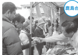
商品を手にとりながら店頭での会話を楽しんでいました。

4月10日から12日までの3日間、「鹿島台互市」が開催され、約7万3200人が訪れました。今回は開催日が土曜・日曜と重なったこともあり、会場は鹿島台昭和通りには、休日でも人でいっぱい。地元の人はもちろん、市内外からお客さんが訪れ、買い物を楽しみながら店頭での会話を楽しまれました。