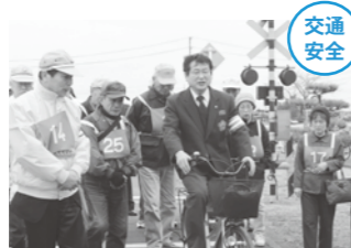
踏み切りを渡る際の注意点を自転車に乗りながら指導中。

4月11日、古川自動車学校で「自転車・二輪車交通安全フェスティバル」が開催され、約100人が参加しました。これは、「春の交通安全県民総ぐるみ運動」期間中に、自転車や二輪車の安全な走行を確認するために行われたものです。参加者の皆さんは、指導員の方たちの話を聞きながら、交通ルールを学びました。