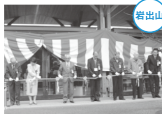
新しい岩出山地区館の前で開館を記念してテープカット。

4月1日、有備館駅前「岩出山地区館」の開館式が行われました。旧岩出山地区館は、町内会やサークル団体などの活動の場として親しまれてきましたが、老朽化が著しいため、有備館駅前の住民協働館に移設されました。新しい岩出山地区館も、地域の交流の場として、皆さんに愛されることでしょう。