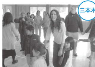
言葉の壁を越え、日本の文化を学びました。

4月4日から8日まで、三本木地域と米国ジョージア州ダブリン市の国際交流で、学生6人を含む男女9人が大崎市を訪れました。三本木地域とダブリン市は、YKKの工場があることが縁で交流が始まりました。本市を訪れた9人は、地域の子どもたちと日本の遊びを体験するなどして、交流を深めました。