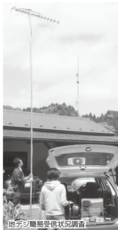
地デジ簡易受信状況調査

松山地域の金谷地区で、五月二十五日に「地デジ簡易受信状況調査」が行われるというところで、調査内容を知るために取材に向かいました。 調査は、UHFアンテナや電波を測る機械を使い、場所ごとの電波の強さを調べるといふものです。