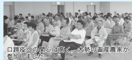
口蹄疫への関心は高く、大勢の畜産農家が参加しました。

説明を行った県北部家畜保健衛生所の担当者は「防衛策は集団で行わないと効果が出ません。消毒のバリエーションを作って、ウイルスの侵入を防ぎましょう」と、消毒の大切さを改めて呼びかけました。