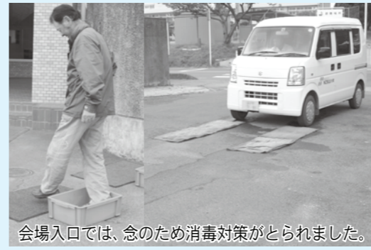
会場入口では、念のため消毒対策がとられました。

石灰)を配布しました。 ◆口蹄疫について 口蹄疫は、牛や豚など四肢の先端に蹄(ひづめ)をもつ偶蹄類(こうていれい)動物に対して非常に感染力が強い病気です。 現在、口蹄疫が発生している宮崎県では、感染の拡大を防ぐため、発生した農場の家畜は殺処分して埋却し、農場を消毒するとともに、発生した農場周辺の牛や豚の移動を制限しています。このため口蹄疫にかかった家畜の肉や乳