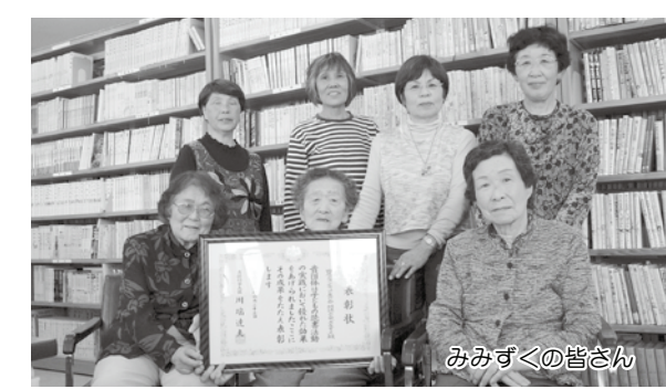
みみずくの皆さん

みみずくは平成9年に発足し、田尻地域の学童保育で読み聞かせや紙芝居、昔語りなどを行ったり、秋に開催される「ボランティアふれあいまつり」でエプロンシアターを行うなど、10年以上にわたって子どもたちへ朗読の楽しさを伝えています。