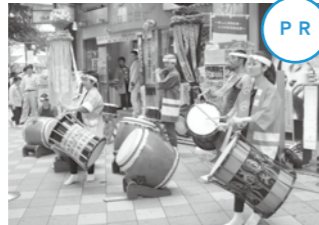
店頭で太鼓を披露する「陸前太鼓」の皆さん

7月5日から11日まで、東京池袋にある宮城県のアンテナショップ「宮城まるごとプラザ(コ・コ・みやぎ)」の開店5周年にあわせ「宮城まるごと大崎市 in 池袋」が開催されました。特産品の試食販売はもちろん、甲冑の無料試着体験などで大崎市をPRしました。会場にはたくさんの大崎市ファンが訪れ、大いに盛り上がっていました。