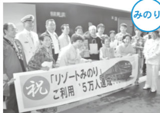
鳴子温泉地域の皆さんが盛大にお出迎え！

7月4日、JR陸羽東線を走る「リゾートみのり」の乗車5万人達成を記念し、古川駅や鳴子温泉駅などで記念イベントが開催されました。 車内では、鳴子温泉宿泊券や鳴子の米「ゆきむすび」などのプレゼントもあり、突然のプレゼントに乗客の皆さんは大喜びでした。これからは「リゾートみのり」は仙台、新庄間を駆け抜けます。