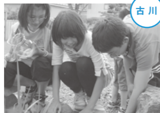
毎日の観察が楽しみです。

古川第四小学校の校庭に今年、ピオトープが作られて、休み時間になると生物を観察する子どもたちが池に集まったり、人気のスポットになっています。 ピオトープとは、生物が生息するための自然に近い空間を再現するもので、環境活動を行っている「大崎自然界部」などが協力して作られたものです。