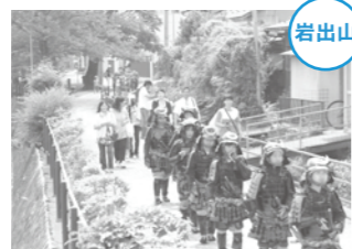
岩出山城の外堀でもあった「内川」沿いで気分は戦国武将！

7月6日、池月小学校6年生11人が、自分たちのふるさと「岩出山」の歴史をもっと知ろうと、体験学習を行いました。甲冑を試着し内川沿いを歩き、旧有備館及び庭園を見学しました。 重さ約15～20kgの甲冑に、子どもたちは「重いけど格好いい」「これで戦いに行くのは大変」などと、歴史を肌で感じていました。