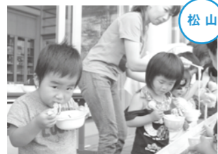
みんな、いっぱいすくってたくさん食べました。

7月16日、松山子育て支援センターで、就学前の幼児親子四十八人が参加し、流しそうめんを食べました。 地域の皆さんからいただいた、大きな竹で作った約10メートルの橋を流れる流しめん、子どもたちは興味深々。普段はあまり経験したことのない食、へ方に夢中になって取り組み、親子で一緒においそうに食べました。