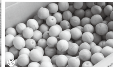
①梅の選別作業②太陽の光をいっぱい浴びて育った梅③厳しい目で選別めかれた梅は美しい形のものばかり