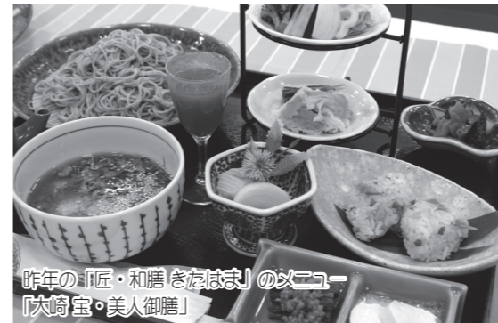
昨年の「匠・和膳 きたはま」のメニュー「大崎宝・美人御膳」