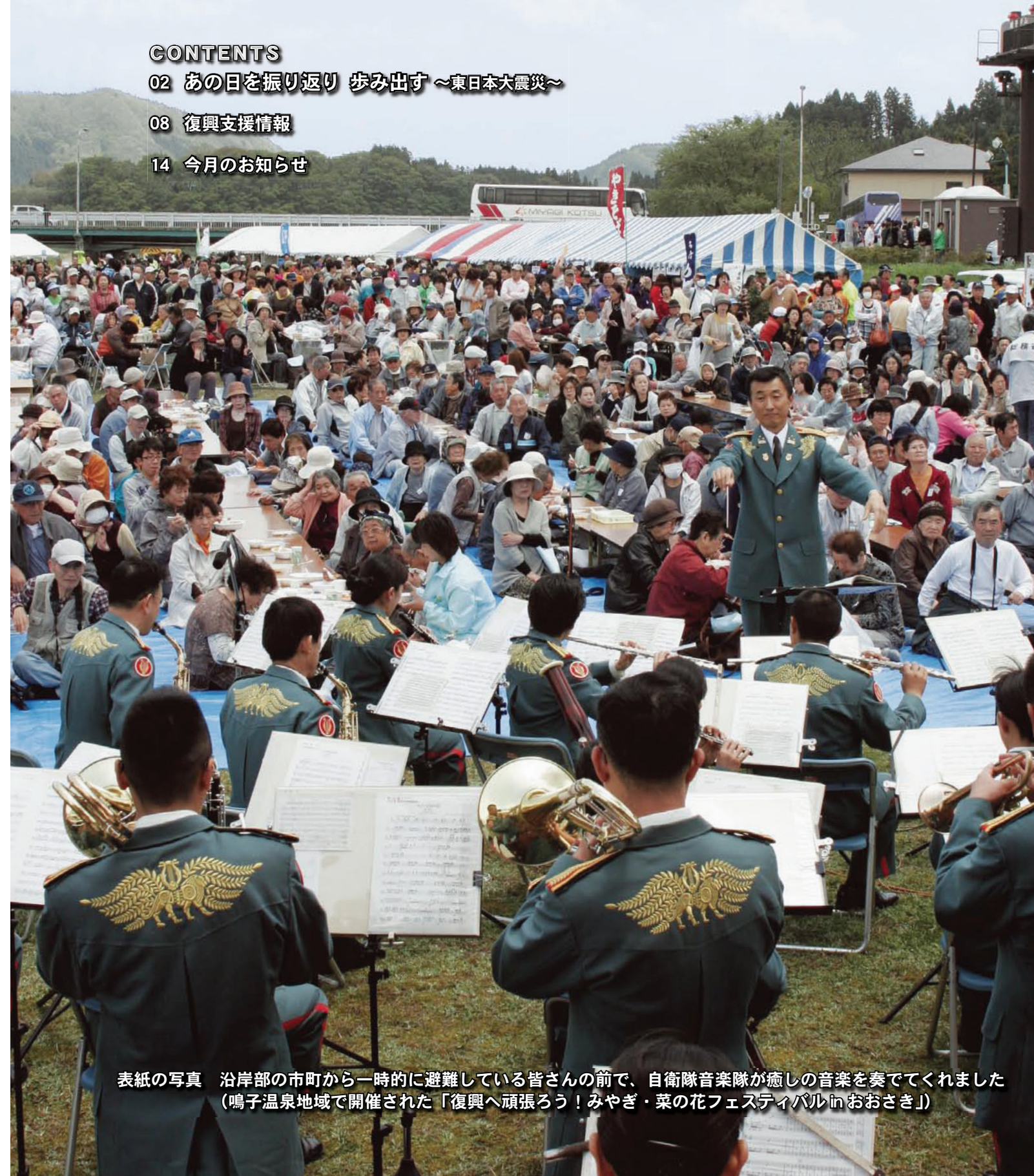
表紙の写真 沿岸部の市町から一時的に避難している皆さんの前で、自衛隊音楽隊が癒しの音楽を奏でてくれました（鳴子温泉地域で開催された「復興へ頑張ろう！みやぎ・菜の花フェスティバルinおおさき」）