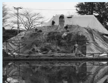
↑地域の皆さんから、1日も早い復元が望まれる旧有備館及び庭園

3月9日、パレットおおさきで「大崎市区公民館の指定管理に関する合同調印式」が開催されました。市に代わり、地域づくり委員会や地区振興協議会などが公民館を管理することで、今まで以上に地域の声や意見を取り入れた事業が期待されます。市内18館のうち、準備が整った13の地区公民館が、4月から指定管理者による地域運営を行います。