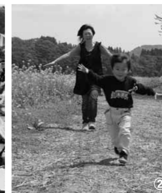
①昨年の自衛隊音楽隊による演奏②昨年の菜の花畑でのひとこま。菜の花畑は、毎年家族連れのお客さんなどでにぎわいます

東日本大震災により被害を受けた皆さんを励ますため、昨年行われた「復興へ頑張ろう！みやぎ・菜の花フェスティバル in おおさき鳴子温泉」が今年も開催されます。