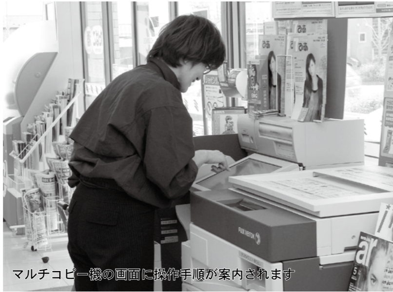
マルチコピー機の画面に操作手順が案内されます