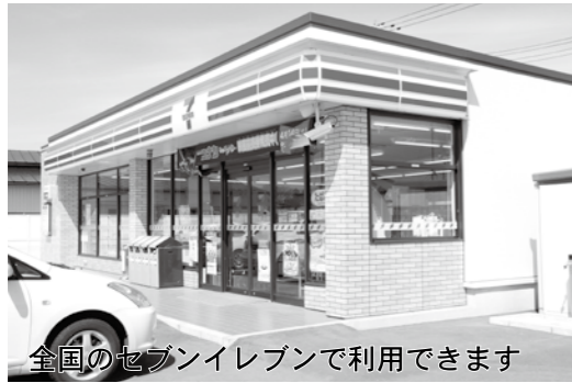
全国のセブンイレブンで利用できます