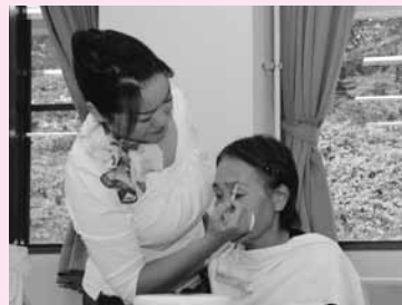
丁寧な指導で、美しい化粧のコツを学びました