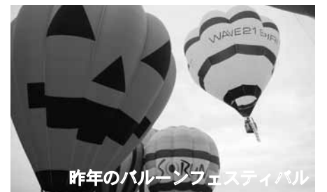
昨年のバルーンフェスティバル