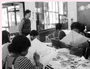
色の調和を整えながら配色したり、ぼかしを施したりと工夫を凝らします

10月14日、大崎市新しい公共の場づくり協議会が主催する「新しい公共フォーラム」が開催され、100人を超える参加者が「わたしが作る大崎の未来」というテーマで話し合いました。米を炊きながらの自己紹介や、席替え、メモを書ける模造紙のテーブルトークなど、意見交換を促すさまざまな工夫が凝らされた形式で、まちづくりについて活発に議論が交わされました。