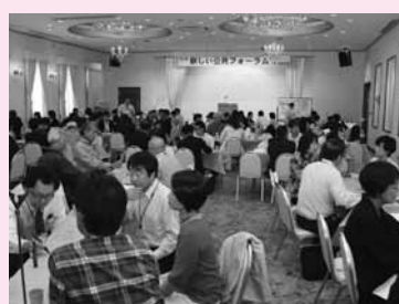
席替えを繰り返すことで大勢の参加者の意見が交じり合いました