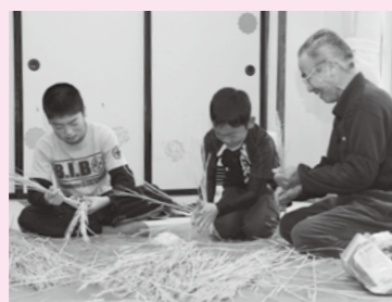
名人の技を真似て、わらをなう子どもたち