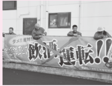
酒を提供する皆さんの「飲酒運転ゼロ！」の願いが込められています

同協議会では、各店に飲酒運転禁止を呼び掛けるコースターも配布し、使用してもらうことにより飲酒運転の根絶を図る活動も行っています。