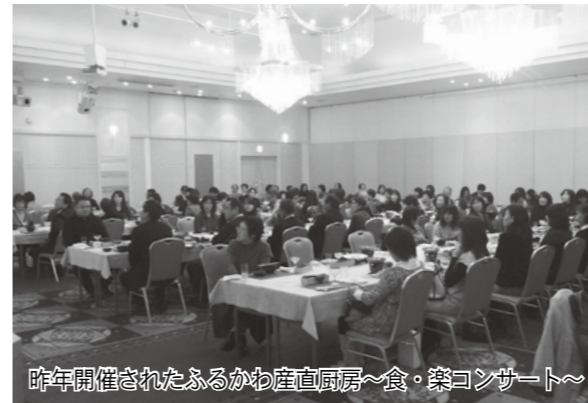
昨年開催されたふるかわ産直厨房～食・楽コンサート～