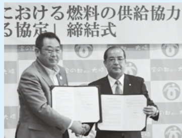
燃料を確保することにより、大規模災害時の応急復旧に役立ちます

5月19日、「古川ふじまつり」が開催されました。緒絶川「藤の散歩道」の間に十二カ所設置され、見事な花を咲かせました。また、夜間には八カ所の藤棚がライトアップされ、幻想的な空間が演出されました。 藤の花は、川岸を往來する皆さんの気持ちと和ませるとともに、季節の風物詩として愛されています。