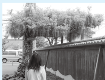
随所に架かる藤棚と緒絶川の景観は、名所として親しまれています