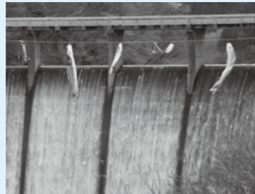
鳴子ダムに幅95m、高さ約80mの巨大な滝が出現しました

5月13日、市はYKKAP(東北北東業所)と「災害時における燃料の供給協力に関する協定」を締結しました。 この協定は、大規模災害時に事業所で保有する燃料を市へ供給し、災害応急復旧のための支援をするものです。 また、事業所の社員が自社の車両を使用し、市災害対策本部が指定する各総合支所などに燃料を配達する人的な支援も行われます。