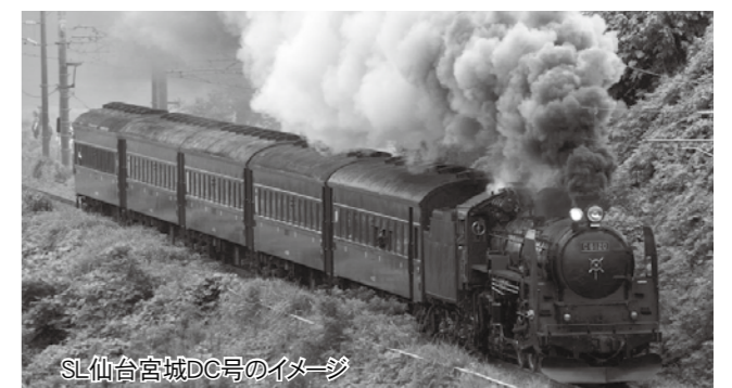
SL仙台宮城DC号のイメージ