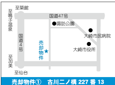
売却物件① 古川二ノ構 227 番 13