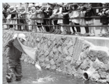
子どもたちが見守るなか、緒絶川に体長約40cmの鯉が放流されました