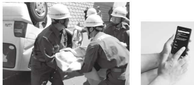
地道な訓練の積み重ねが、いざというときに役に立ちます。多くの人に関わり、体験することが大切です。

日時 6月15日(日) 9:00～12:00 場所 長岡小学校と古川長岡地区周辺 駐車場 古川北中学校と古代の里公園(シャトルバスを運行します) 内容 初期消火・応急救護・救出訓練・炊出し訓練・人員輸送訓練・ライフラインに関する企業展示など その他 一般の人も参加できる体験訓練もありますので、この機会にぜひ体験してみてください。