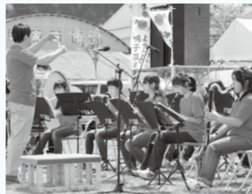
岩出山中学校吹奏楽部による演奏は、来場者に元気を与えてくれました

初夏の訪れを告げる 緒絶川、鯉の放流 5月16日、古川地域のふじまつり開催イベントとして、緒絶川荒川清流化促進協議会の皆さんが、緒絶川に鯉50匹を放流しました。放流された鯉は、子どもたちの投げパンのかけらを食べながら、上流に向かって元気に泳いでいました。ふじまつりは6月15日まで行われ、期間中は、鯉の泳ぐ緒絶川沿いの藤棚をライトアップしています。