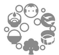
みやぎ大崎 ふつつ共和国

大崎市の魅力をキャッチフレーズにした「みやぎ大崎ふつつ共和国」。発酵食文化や自然歴史など、多様な魅力と重ねて表現し、「ふつつ」という擬音によってあらわしています。また、「共和国」という多様性を集束する言葉で、たくさんの「ふつつ」が集った一体感をあらわしています。