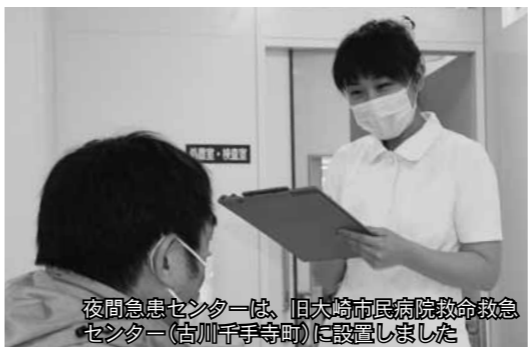
夜間急患センターは、旧大崎市民病院救命救急センター(古川千手寺町)に設置しました

【社会人試験(看護師)】 採用予定人員 1人程度 職務内容 看護の専門業務 勤務場所 夜間急患センター 受験資格 昭和40年4月2日以降に生まれた人で、看護師または准看護師の資格を有する人