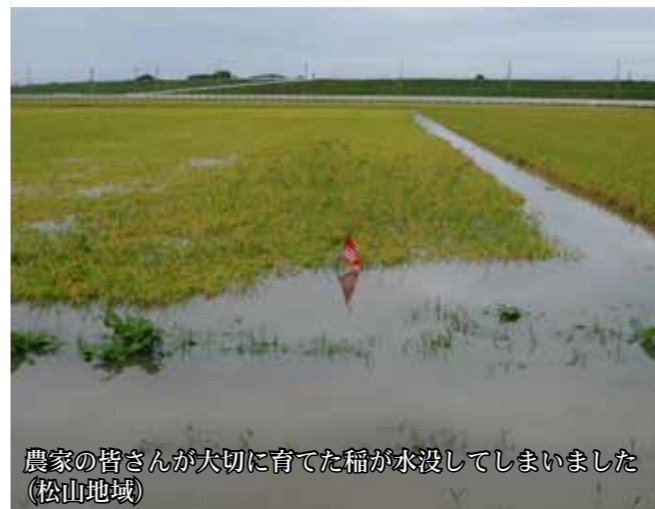
農家の皆さんが大切に育てた稲が水没してしまいました(松山地域)