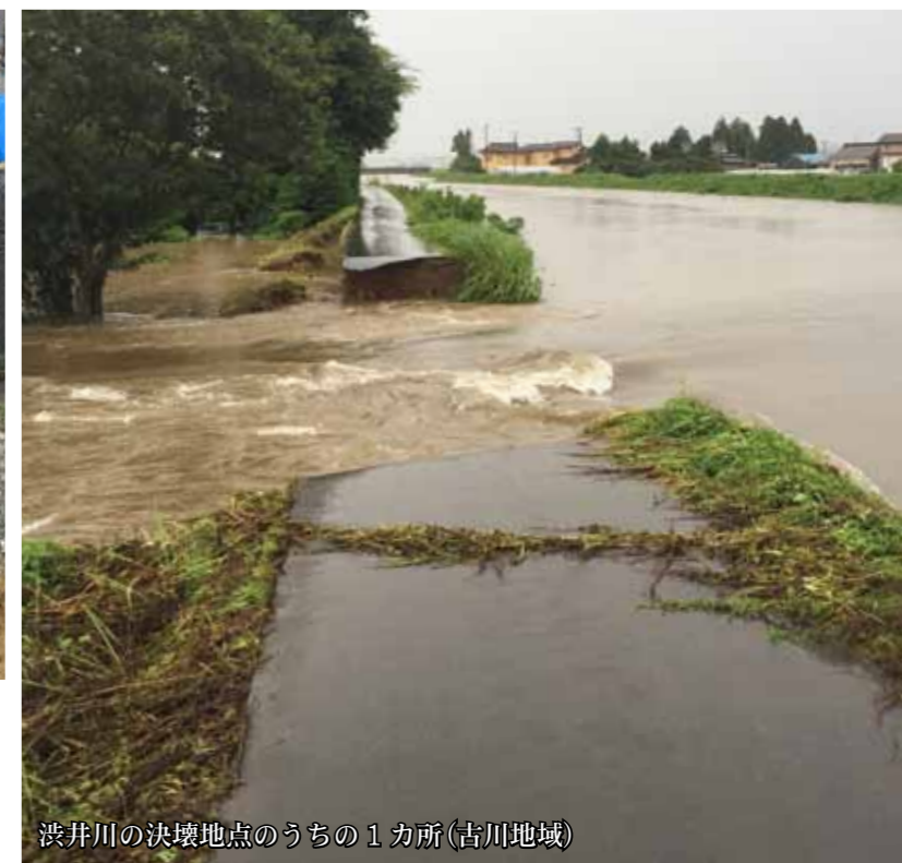
渋井川の決壊地点のうちの1カ所(古川地域)