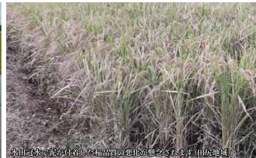
水田冠水で泥が付着した稲品質の悪化が懸念されます(田尻地域)