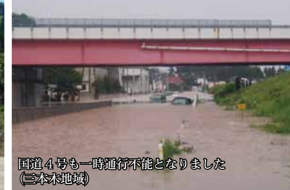
国道4号も一時通行不能となりました(三本木地域)