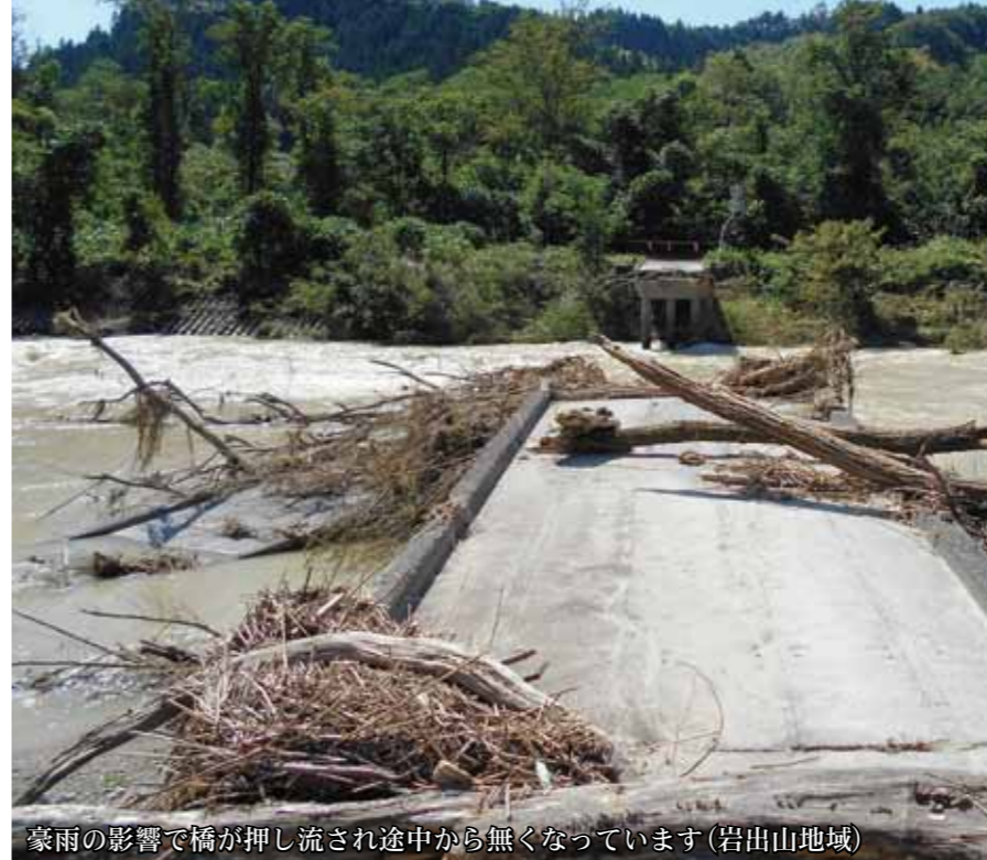
豪雨の影響で橋が押し流され途中から無くなっています(岩出山地域)