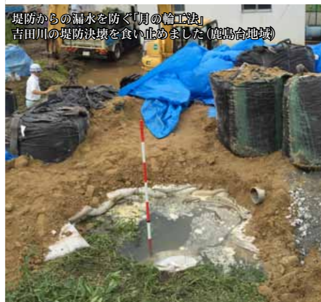
堤防からの漏水を防ぐ「月の輪工法」 吉田川の堤防決壊を食い止めました(鹿島台地域)