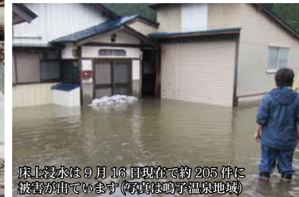
床上浸水は9月16日現在で約205件に被害が出ています(写真は鳴子温泉地域)