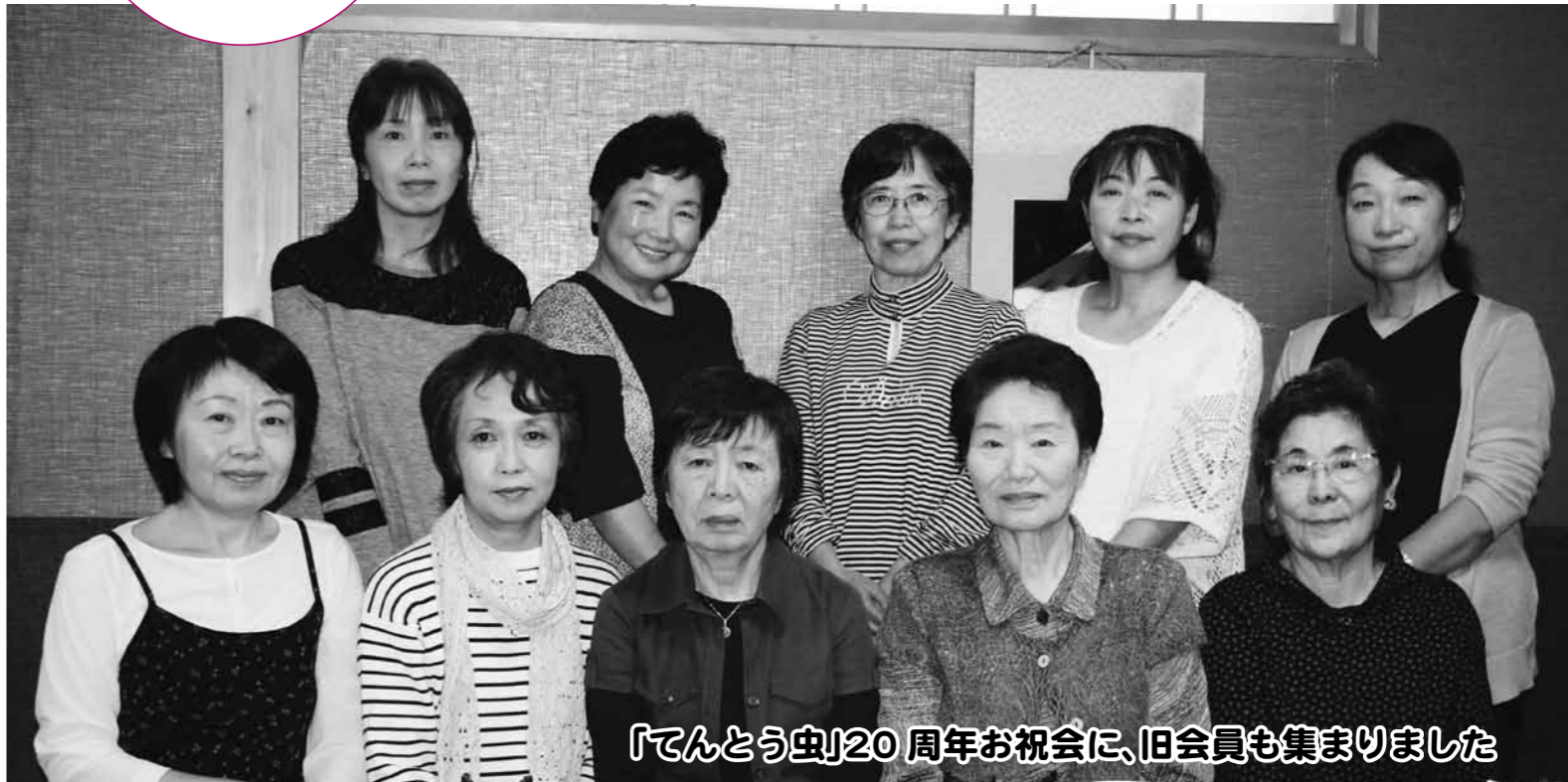
「てんとう虫」20周年お祝会に、旧会員も集まりました

15歳で目が全く見えなくなりました。広報おおさきは楽しみで、すべての記事を読んでいます。特に、市長コラムなどが楽しみです。「てんとう虫」の皆さんには点訳した広報を作成してもらい、本当に助かります。