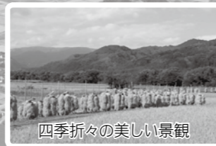
四季折々の美しい景観

1974年東京大学理学部地理学科卒業、 1976年同大学院農学系研究科修士課程 修了。東京大学国際高等研究所サステイ ナビリティ学連携研究機構(IR3S)機構 長・教授。国際連合大学(UNU)上級副学長、国際連合事 務次長補を併任。日本学術会議会員、食料・農村 政策審議会会長代理なども務める。著作に「世界農業 遺産 注目される日本の里地里山」(祥伝社新書)など