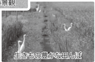
生きもの豊かな田んぼ