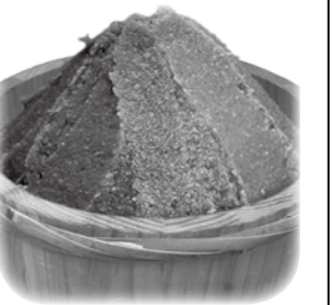
▲藩政時代に伊達政宗が奨励した「みそ」