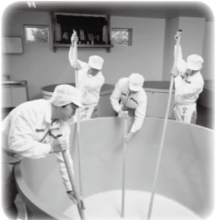
▲伝統の技法により仕込が行われる「酒造」