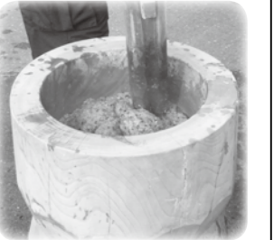
▲行事に欠かせない楽しみの食「もち」