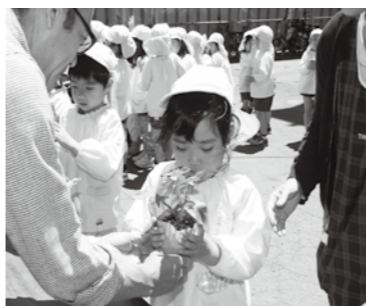
▲受け取った苗を、宝物のようにしっかり抱えてプランターへ運びます

地球温暖化対策率先実行計画の一環として、市役所を訪れた人たちに、グリーンカーテンの効果を知らせてもらうため、平成21年度から取り組みを始め、隣接する純心幼稚園の子どもたちに、毎年、植栽作業を手伝ってもらっています。園児たちは、ゴーヤやアサガオの苗を手渡されると、両手で大事そうに受け取り、丁寧にプランターへ植え、水やりを行いました。