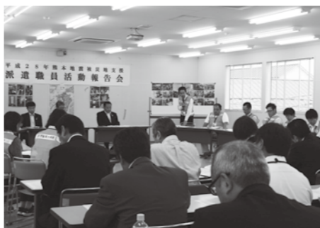
▲次の支援につなぐため、派遣職員から、現地の状況が報告された

その活動報告会が、5月26日に行われ、現地の状況を目の当たりにしてきた職員たちからは、「倒壊したまま手つかずの建物が多く、一人になりたくない、夜が怖いと訴える住民もいた」「東日本大震災の経験から見直しを重ねてきた、災害時に家庭訪問で使用する健康相談票が、益城町で