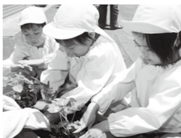
▲プランターに入ったふかふかな土は、「苗のおふとんだね」と話しながら丁寧に植えていました

晴れた日には、引き続き園児たちが水やりを行い、8月には、約4メートルの大きなカーテンが目見えします。いっぱい実をつけるゴーヤは、食育活動の一環として、園児たちが収穫し、おいしく味わうそうです。