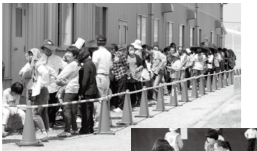
▲チケット販売初日は、日差しが強い日にも関わらず、多くの皆さんが列に並びました

第一線で活躍するプロの演奏やパフォーマンスを、間近に聞いて、見て、参加して、児童たちは最後までコンサートを楽しんでいました。