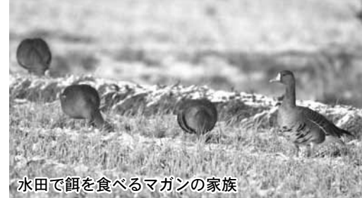
水田で餌を食べるマガンの家族

そのため、大崎耕土は日本でも最大のマガンの飛来地で、全国に飛来する18万羽のうち10万羽が越冬します。