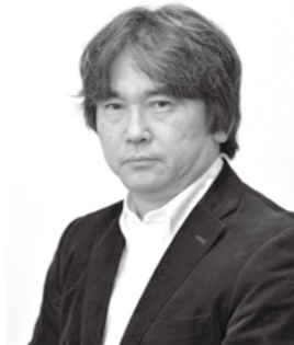
作家 真山 仁 氏

「マグマ」「レッドゾーン」「ベイジン」など数多くのヒット作を生んだ作家の真山 仁 氏が、地熱をテーマに講演を行います。