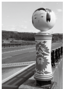
▲完成したこけしが来訪者を最初に出迎えます