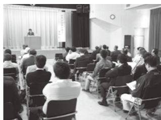
▲多くの皆さんが耳を傾けました

ネルギー資源の乏しい日本に最もふさわしいと実感し、地熱ファンになったそうです。鳴子温泉地域で地熱を利用する取り組みについて「観光資源など、持っているものが豊かであればあるほど危機感を持っていない。地方の自立が求められる時代において、地域を見つめ直し、自分たちが持っているものを武器にして産業を生み出していくためには、規制や利害の調整も必要だが、できない理由を探すのではなく、できることを探してほしい」と、熱いエールを送ってくれました。