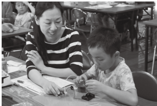
▲配線を確認しながら、ひとつひとつ組み上げる

当日は、企業や学校、研究機関など約60の団体が参加し、大崎地域で生まれた優秀な技術や製品が展示されました。授業で訪れたという高校生たちは、普段はなかなか見ることができない地元企業の技術や製品の説明に聞き入る姿もありました。