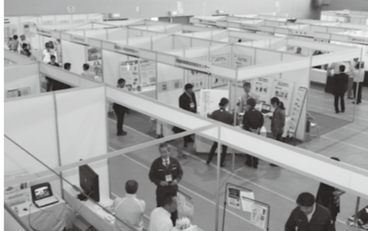
▲製品の紹介や情報交換が行われる会場内

LED電球を使用した工作コーナーに参加した子どもたちは、説明書と部品を見比べたり、親に助言をもらいながら、親に親に近づく工程に「ものづくり」の楽しさを感じているようでした。市では、さまざまな連携を通して生まれた、大崎地域の優れた技術や製品を広く発信し、持続可能な産業都市の形成を目指します。