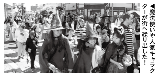
▲魔法使いや人気キャラクターが街へ繰り出した！