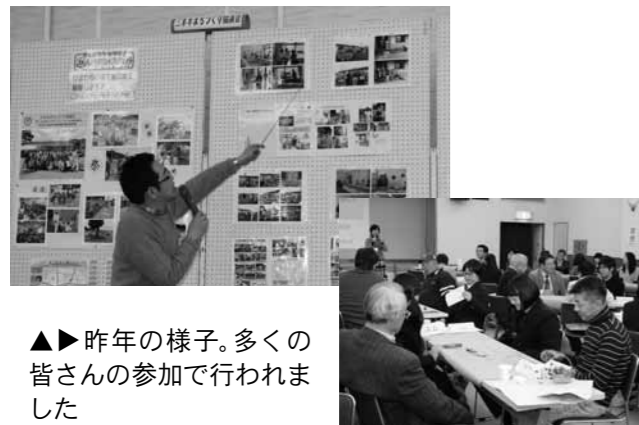
▲▶ 昨年の様子。多くの皆さんの参加で行われました