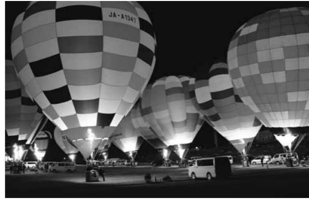
▲昨年に引き続き、今年もバルーングローが開催されます

色とりどりの熱気球が、大崎の秋空を彩ります。早起きして、秋空に舞う熱気球から岩出山地域を見てみませんか。夜には、気球をライトアップする「バルーングロー」を実施します。